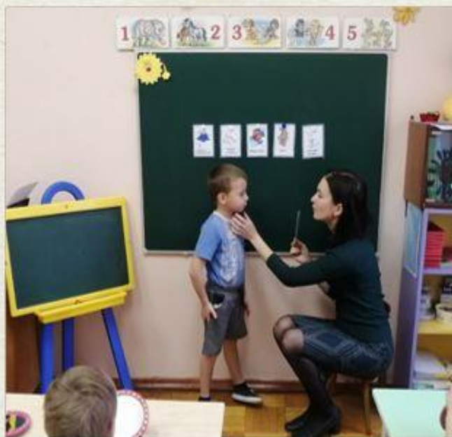
Дыхательное упражнение "Холодный ветерок подул на теремок"