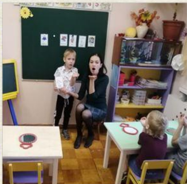
Дыхательное упражнение "Теплый ветерок подул на теремок"