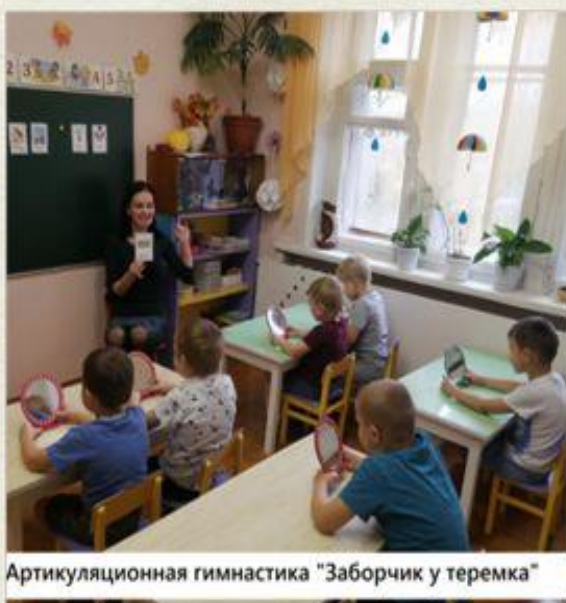
Артикуляционная гимнастика "Заборчик у теремка"