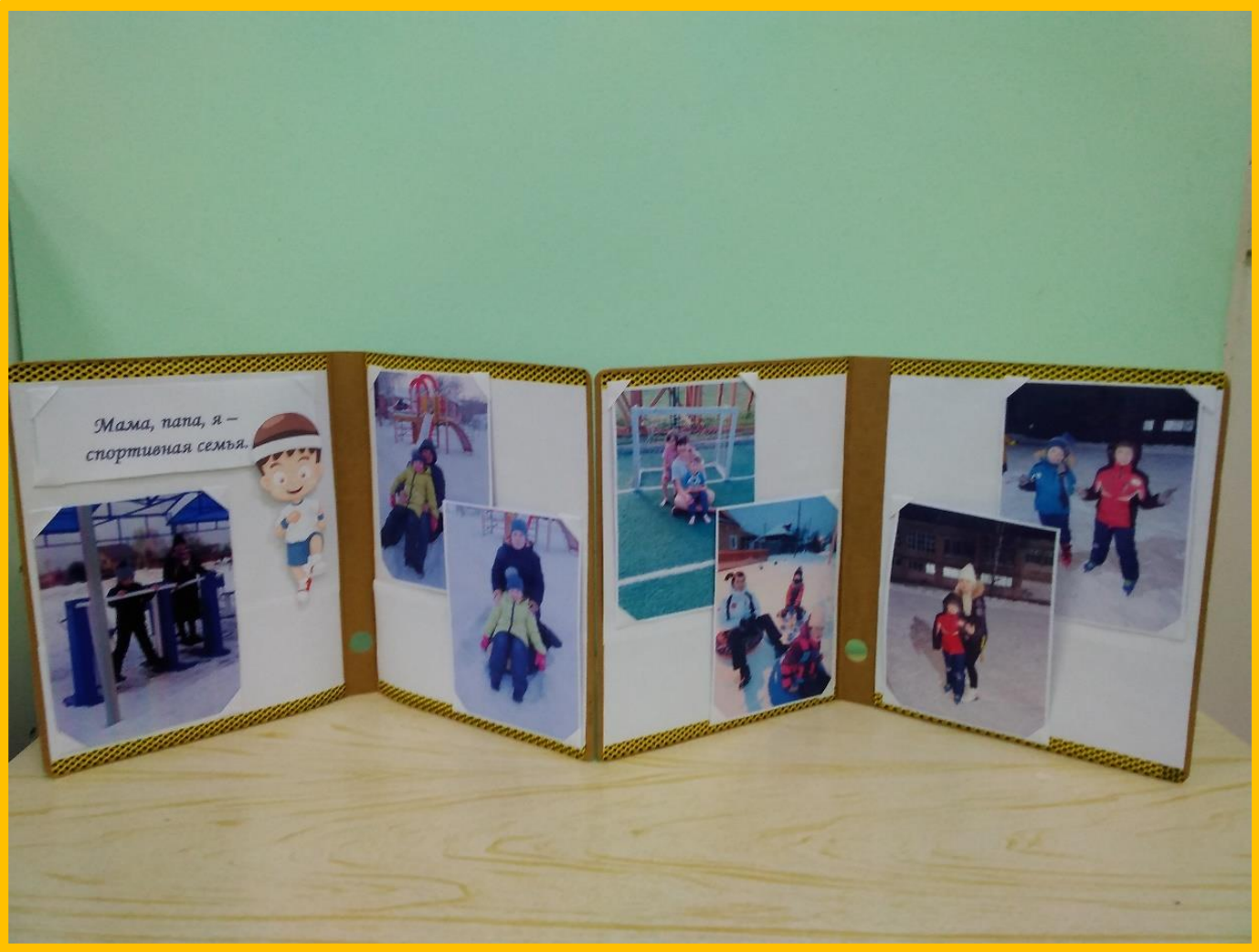
ШИРМА «МАМА, ПАПА, Я – СПОРТИВНАЯ СЕМЬЯ»